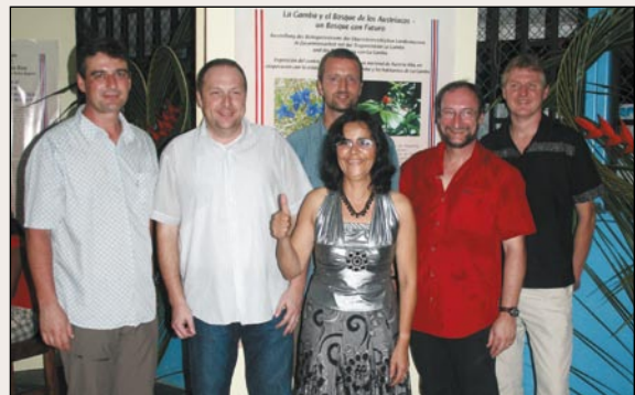
Die Veranstalter und Organisatoren der Ausstellung „Österreich in Costa Rica“ bei der Eröffnung der Ausstellung in La Gamba.

Diese liegt nun sehr gelungen vor. Wir gratulieren seitens des Biologiezentrums und freuen uns, dass unsere Ideen so zielorientiert aufgenommen wurden und vor allem weitere menschliche und kulturelle Kontakte erwarten lassen. Ein wichtiger Schritt zum Verständnis des Lebensraumes „Tropischer Regenwald“ und zu seiner Erhaltung wurde damit eindrucksvoll gesetzt.