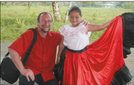
Der Direktor des Biologiezentrums Linz mit einer Tänzerin aus La Gamba.

Ahora se presenta este importante logro. De parte del Centro de Biología expresamos nuestras felicitaciones y nos alegramos que con ese propósito nuestras ideas hayan sido acogidas, esperando más contactos humanos y culturales. Con ello se dio, de forma impresionante, un importante paso para el entendimiento y la conservación del espacio vital “bosque lluvioso tropical”.