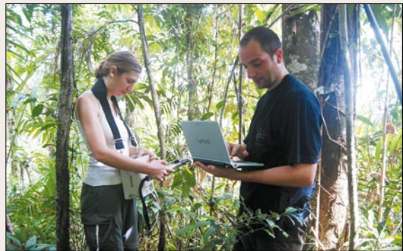
Ausgestattet mit Photosynthesemessgerät und Computer arbeiten Studenten der Universität Wien.