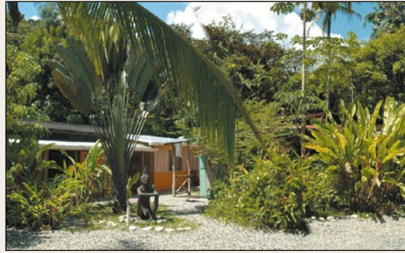
Die Tropenstation La Gamba am Rande des „Regenwaldes der Österreicher“ wird von der Universität Wien und vom Ministerium für Wissenschaft und Forschung (bmwf) unterstützt.