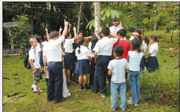
Umweltunterricht für Schulkinder aus La Gamba in der Tropenstation La Gamba.