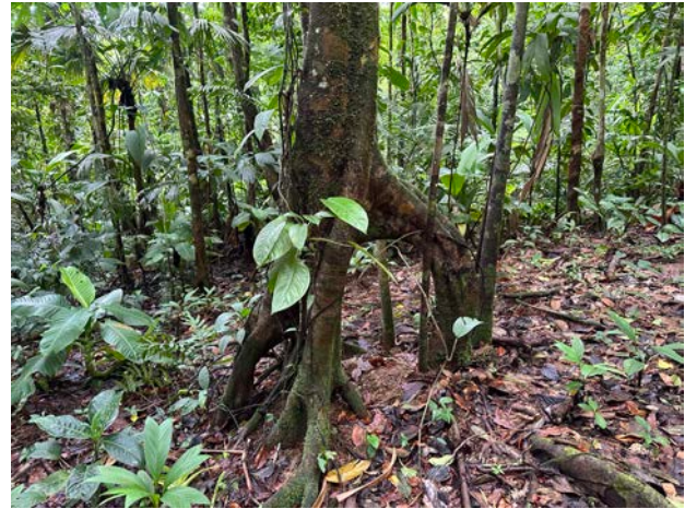
Symphonie globulifera (Clusiaceae).

Grenze zur Finca Alexis 3, wodurch auch dieser Flussabschnitt geschützt ist. Die Finca ist ca. 40 min. Fahrzeit (4 WD) von der Tropenstation entfernt und ganzjährig erreichbar. Astrid und Werner Klar bieten in der Nähe eine einfache Unterkunft für Forschungszwecke an.