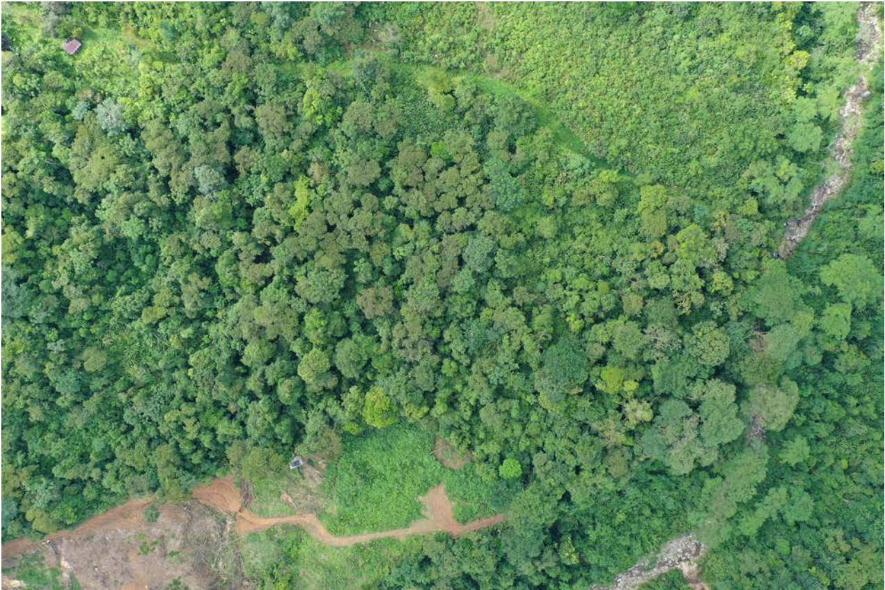
Drohnenaufnahme von der Finca La Virgen. Im Süden ist eine illegale Abholzung erkennbar.