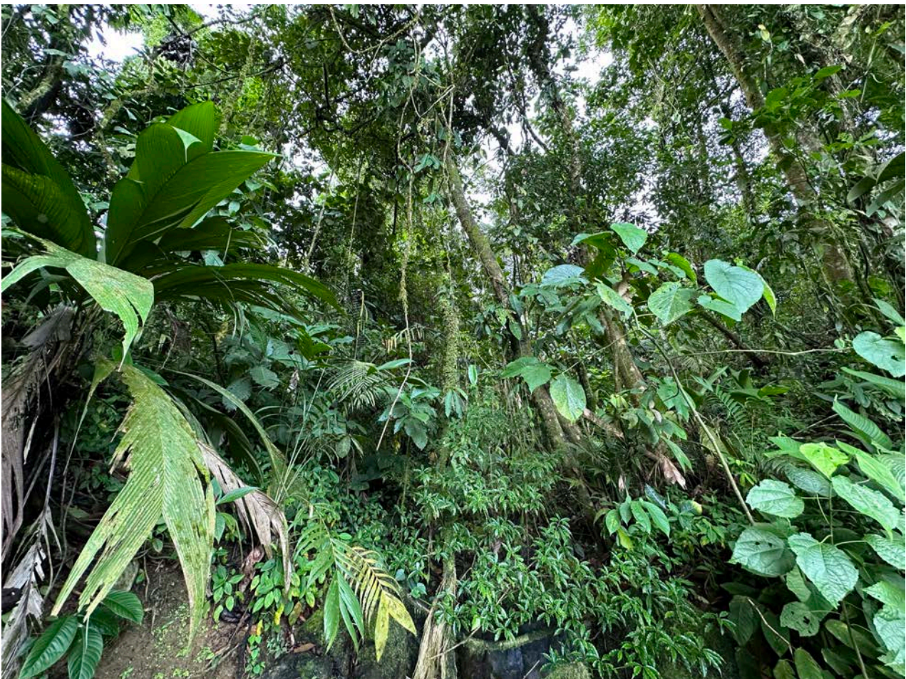
Blick in das artenreiche Waldesinnere der Finca La Virgen,