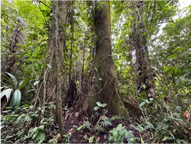
Große Bäume mit Brettwurzeln sind häufig.