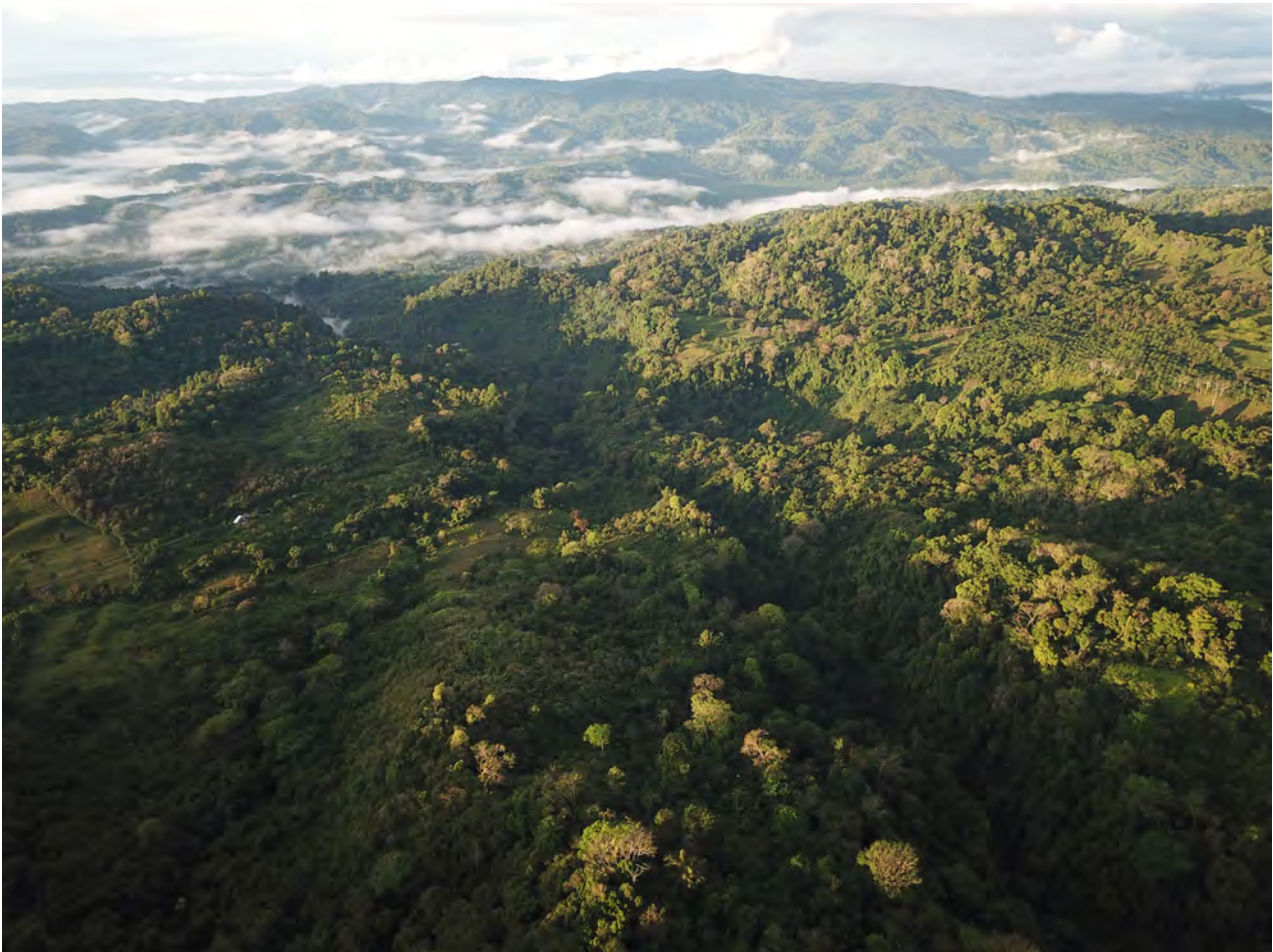
Blick von der Finca Marvin im Vordergrund auf den Nationalpark Piedras Blancas. Das La Gamba Tal liegt im Nebel. Februar 2020.

Die Finca Marvin ist mit dem Auto in weniger als einer Stunde von der von der Tropenstation ganzjährig mit dem Allrad erreichbar (16 km). Ganz in der Nähe befindet sich die Finca Alexis, ein Bauernhaus mit Übernachtungsmöglichkeiten das für Forschungs- und Umweltschutzaktivitäten im Bereich der Fila Cal genutzt werden kann.