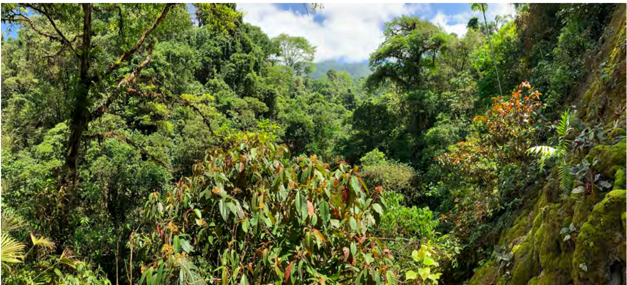
Entlang des Río Esquinas gibt es noch primäre Schluchtwälder und zahlreiche Wasserfälle. Februar 2020.