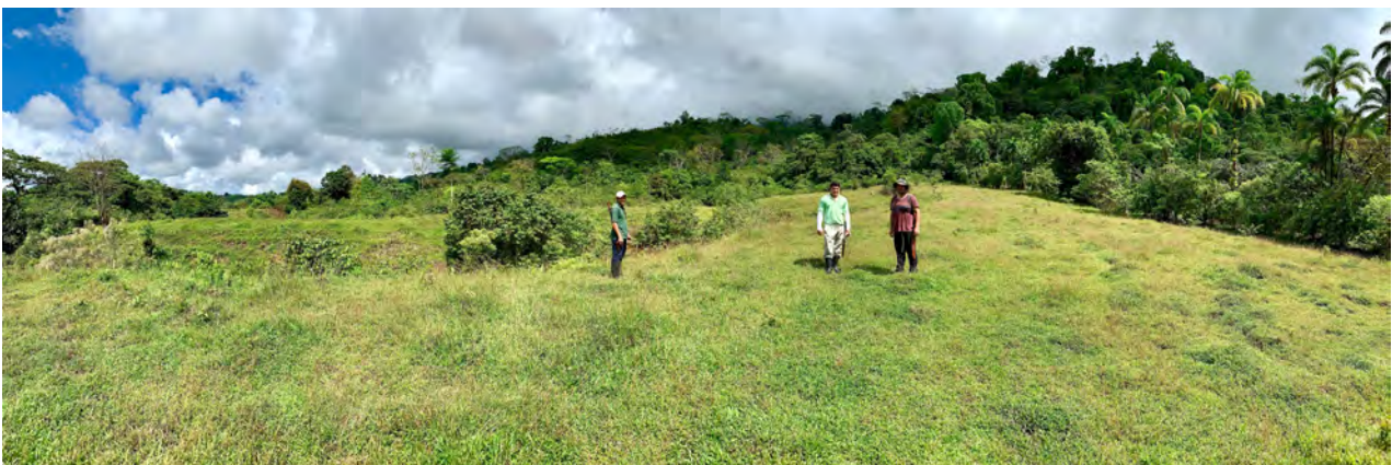
Teile der Finca wurden als Viehweide genutzt und sollen mit einheimischen Baumarten wieder bewaldet werden. Februar 2020.