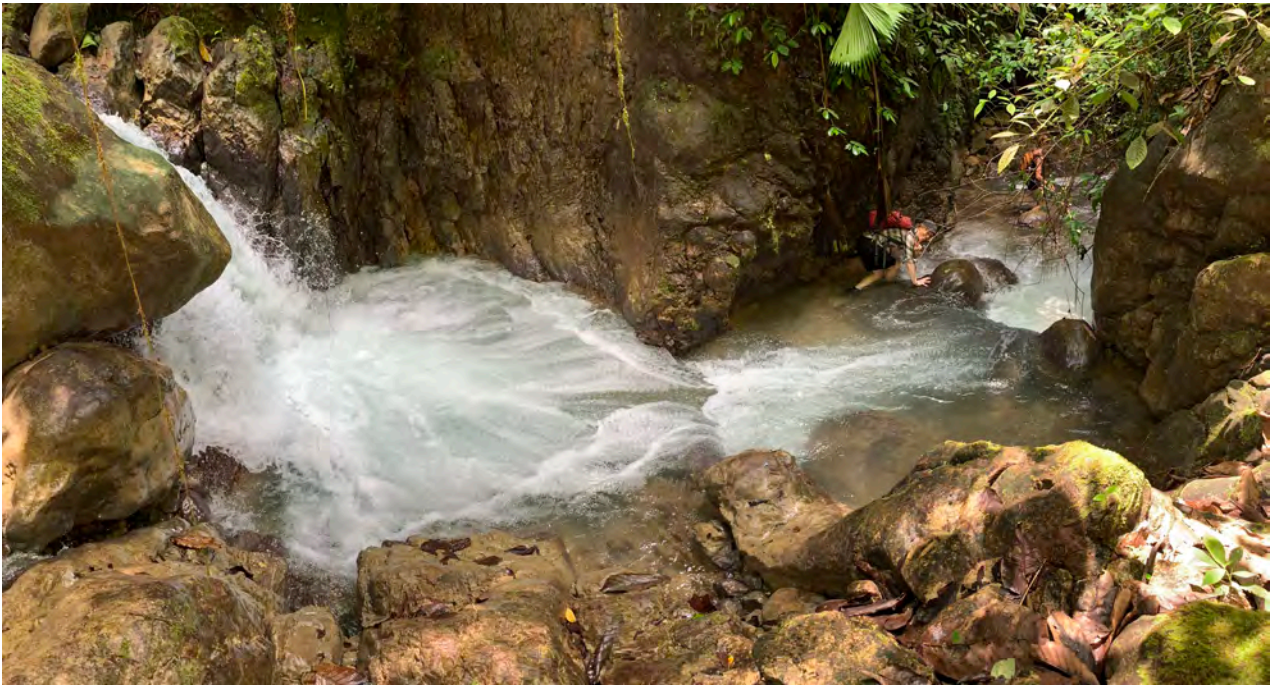
Ein Seitenarm des Río Esquinas bildet die westliche Grenze der Finca. Februar 2020.